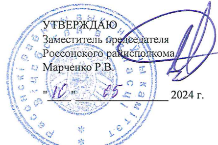
ГРАФИК оформления и регистрации паспортов готовности потребителей тепловой энергии и теплоисточников к работе в осенне-зимний период 2024/2025 года организациями Россонского района